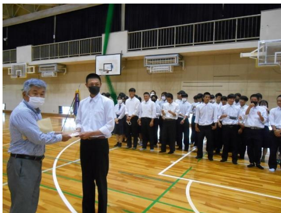
同窓会より「激励金」