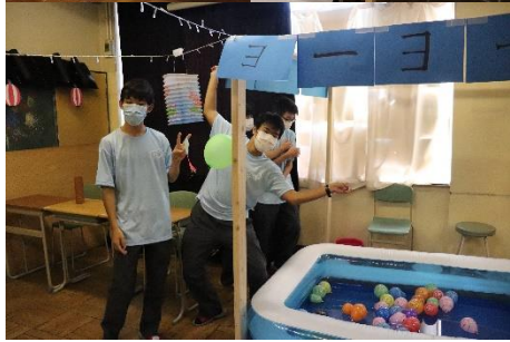
【縁日・創作ゲーム部門 優秀賞】 1年5組「あの夏の思い出」