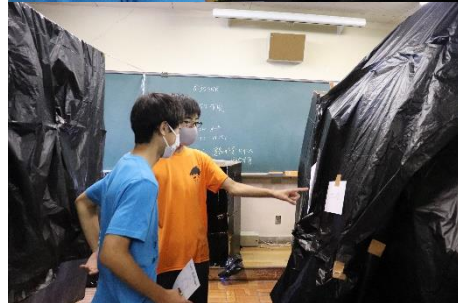
【新人賞】 1年2組「謎解きの迷宮」Labyrinth」