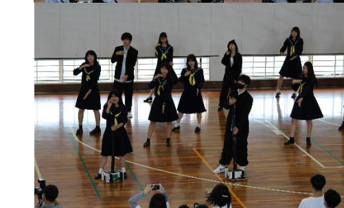
【3年パフォーマンス】