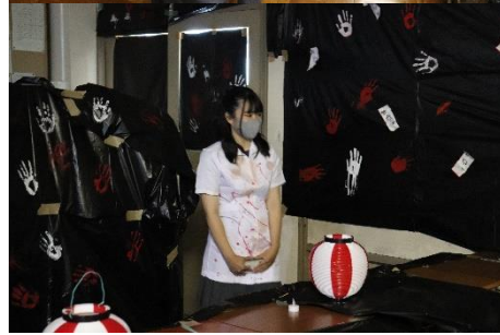
【イベント部門 優秀賞】 1年3組「ドキドキパニック」