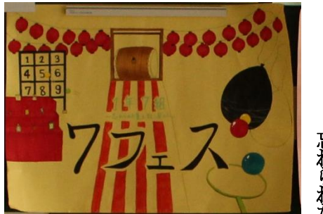
【クラス宣伝看板1年 優秀賞】 1年7組「フエス」 「忘れられた夏を取り戻せ！」