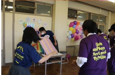
【最優秀賞】 2年1組「突き進め熱球豪球フレイム」 「モッピョーがやらねば誰がやる」