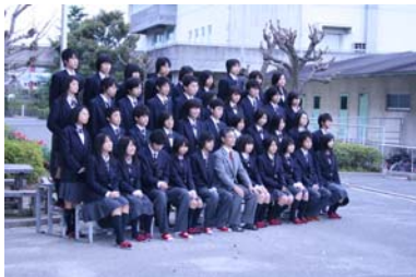
入学式後のクラス写真撮影