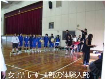
女子バレーボール部の体験入部

「芥川高校に入学したらまず部活動しよう」という決意を持って来てくれた新入生が多いようです。今年度も部活動一斉体験入部で新入部員の勧誘を行いました。さっそく多数の入部があり、学校全体が活気づいています。