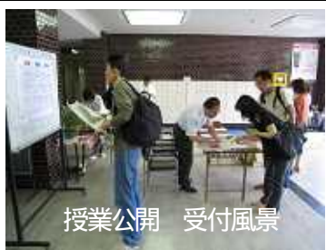
授業公開 受付風景

6月14日（土）に授業公開を行い、約80名の保護者の皆様にご参観いただきました。廊下で会ったときに気軽に挨拶してくれたり、授業中も全体的に静かに聞いている子どもが多かったです。毎日子どもが楽しく通っている学校を見るのができてよかったです。などの感想をいただきました。2学期は、11月15日（土）に予定しておりますので、今回参加いただけなかった方もぜひご参加ください。