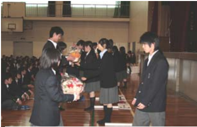
新入生各クラス代表に花束贈呈