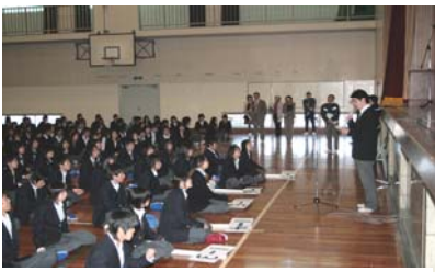
生徒会長から歓迎の挨拶