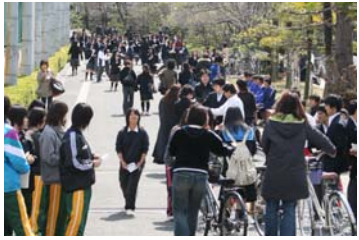
熱心に新入生を勧誘する部活動の生徒たち(3/24合格者説明会)

活発な部活動に惹かれて本校を選んでくれた人も多いためです。今年度も部活動一斉体験入部で新入部の勧誘を行いました。さっそく多数の入部があり、学校全体が活気づいています。