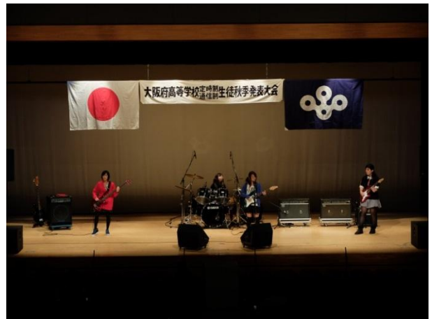
定時制通信制 生徒秋季発表大会の様子(H27.10.11)