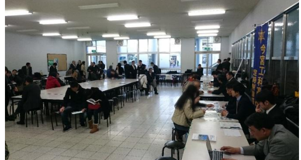
昨年度の合同相談会の様子(H28.2.7)