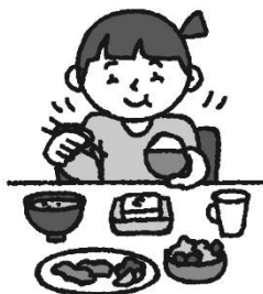
し ゃ く じ バランスのとれた食事