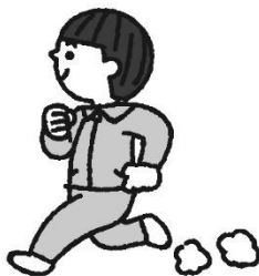
て き と う ん じ ゅ う 適度な運動