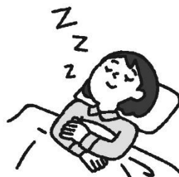
す い み ん じゅうぶんな睡眠