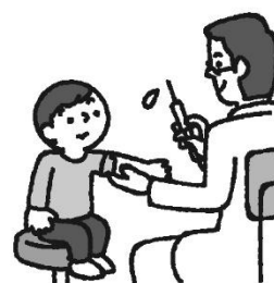
よ ぼ う せ つ し ゅ う 予防接種