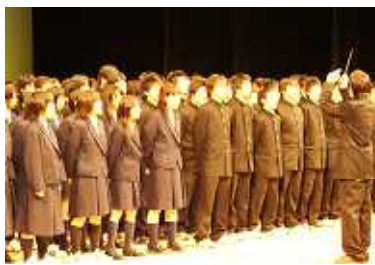
本校50周年記念式典より

体育祭閉会式の校旗降納時には、吹奏楽部の演奏に合わせて自然と皆が校歌を口ずさみます。感極まるなか健闘をたたえ合う姿は感動ものです！