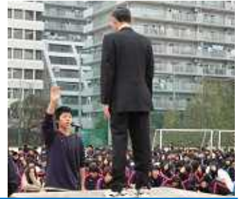
運動委員長による選手宣誓

11月5日、晴天のなか球技大会が行われました。本校の球技大会は、生徒の自主活動力の育成と集団づくりを目標に、運営は生徒会執行部と運動委員、全試合の審判を運動系クラブ員が担当しています。クラス全員が試合に出場し、クラス全員で応援します。白熱した競技とともに熱の入った応援も球技大会のみどころとなっています。