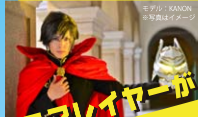
モデル: KANON ※写真はイメージ