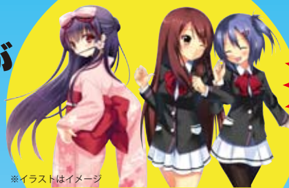
※イラストはイメージ