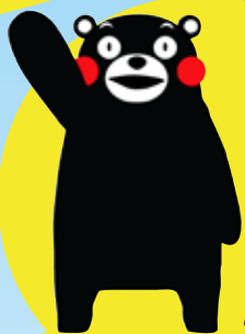
協力 熊本県大阪事務所