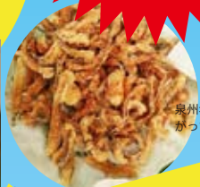
泉州名物 かつよの唐揚げ!