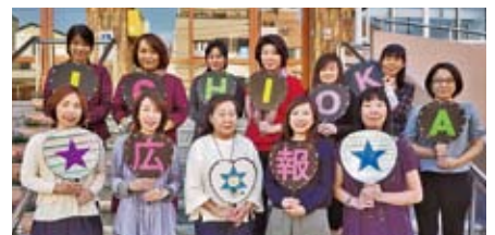
編集後記：広報委員会