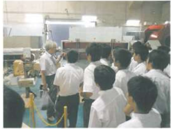
■ (独) 理化学研究所 発生・再生科学総合研究センター 研修