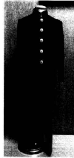
詰襟 黒、五つボタン 校章（バッジ）は自身の左襟に着用