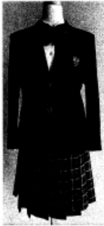
プレザー 濃紺 学校指定のネクタイ及びリボン