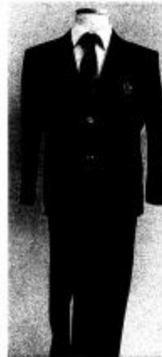
ブレザー 濃紺 学校指定のネクタイ

夏 標準服Aの上着は、白のカッターシャツ ※ネクタイについては、気温等により個人の判断に任せる