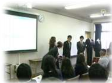
着こなしセミナー