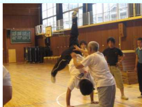
校内研修会で体育の実技指導