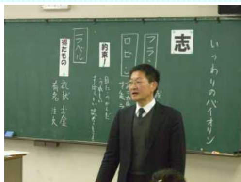
魅力ある道徳の授業づくり

「本気で授業力・指導力を磨く教員が集うカリナビでありたい」と願い 多様なニーズにも応えるため 教育センターはいつでもサポートします