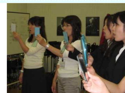
音楽の相談会で発声法の実技研修

市町村教育委員会や幼稚園、小学校、中学校、府立高等学校・支援学校で開催される研修会を支援します