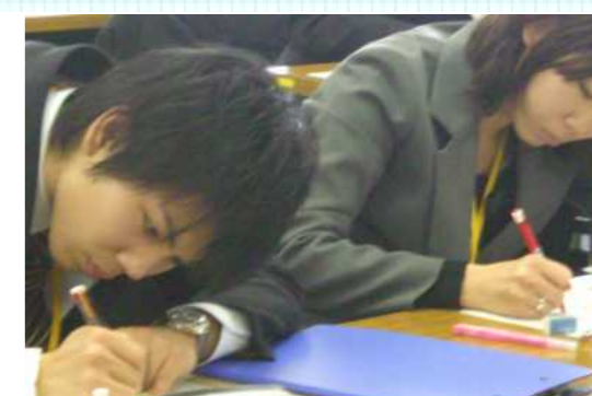
教員をめざして学ぶべきことは尽きない

ボランティアの先輩教員たちの心強いサポート! 時には 人生の師「メンター」としての出会いも生まれます