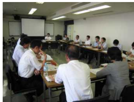
サポート講座で自主研修会