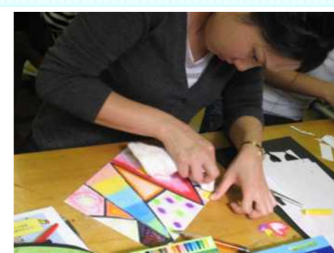
図画工作の相談会で実技研修