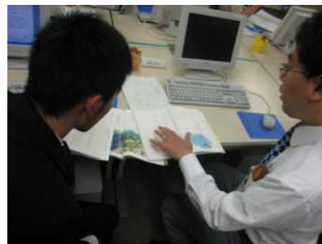
教材解釈から指導案を作成