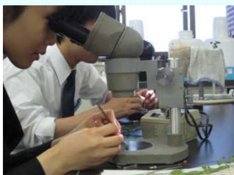
小学校理科実験相談会で教材づくり

カリスマ教師やその道のプロフェッショナルとして活躍されている多彩な講師が 授業力向上 教師力向上にサポートします