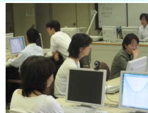
新しい教材ソフトを使って授業づくり