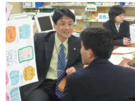
初任者の悩みにきめ細かく応対