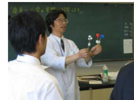
理科の簡単な実験方法はこうすればいいよ

「本気で授業力・指導力を磨く教員が集うカリナビでありたい」と願い 多様なニーズにも応えるため 教育センターはいつでもサポートします