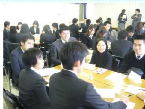
4月からの教師生活も仲間と出会え安心!