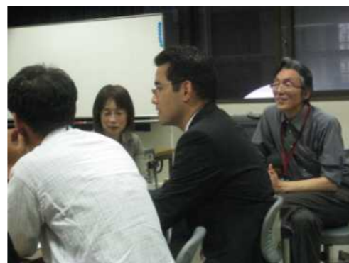
集団づくり・学級づくりのポイント