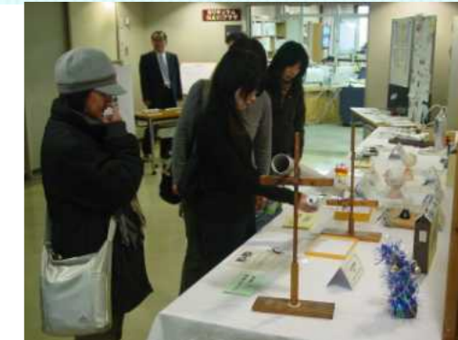
授業実践コレクションで教材開発

カリスマ教師やその道のプロフェッショナルとして活躍されている多彩な講師が 授業力向上 教師力向上にサポートします