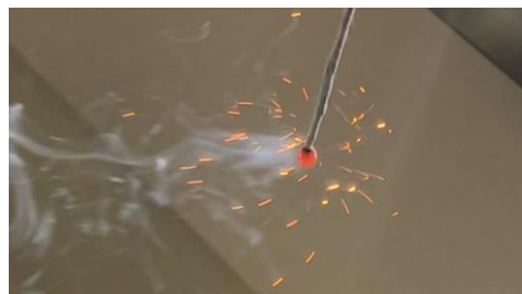
黒色火薬から作る 手作り線香花火

様々な科学の実験をします。 写真のような面白い実験もできます。 理科好きは、ぜひ来てください！ 今年度はガラス玉の製作を行います！