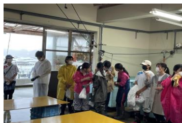
作業場(おかえりモネで撮影)