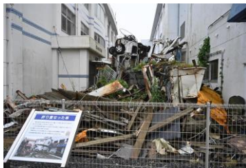
伝承館1階車が縦向け