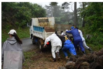
スタックしたトラックを押し出す