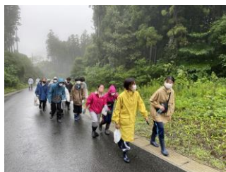
作業場所まで移動