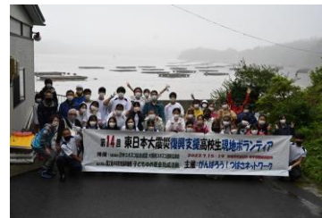
ヤマヨ水産養殖筏を臨む