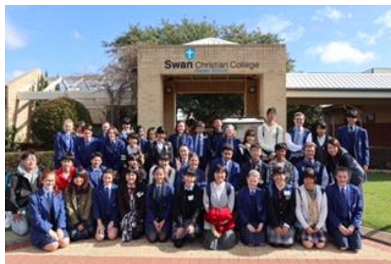
バディと共に記念撮影

緊張していた顔も大分打ち解けてきたのか、いい顔になってきました。日本語の先生をはじめ、大変よくしていただいています。月曜日には生徒朝礼で挨拶をすることになりそうです。