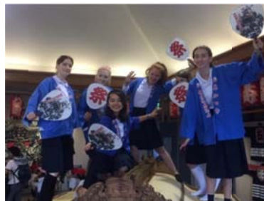
だんじり会館にて