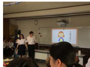
ドイツ生徒プレゼン