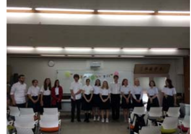
お別れ会にて ドイツの歌披露