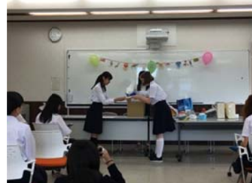
日本研修修了証書 岸高生より授与