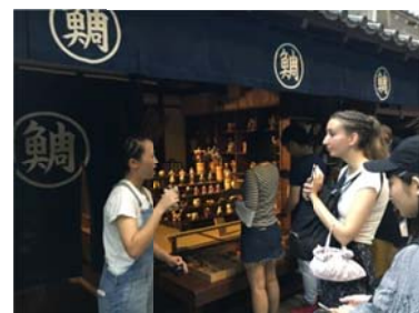
くらしの今昔館にて 英語で説明