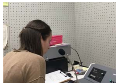
全校生徒に向けて日本語でスピーチ