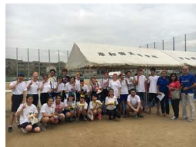
パディ生徒とともに