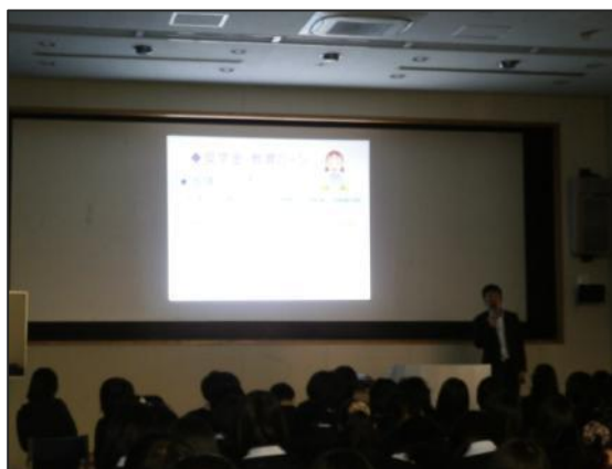
進路 HR で奨学金の説明です