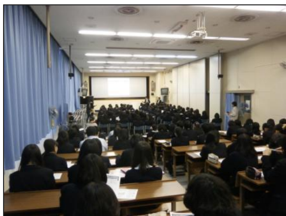
3 年生 200 名が使用