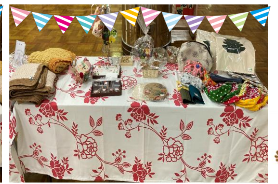
(もみじフェスタバザー)