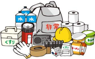
(非常用持ち出し袋)

・ 備蓄品の白米と水を購入し、学校に保管済みです。 ・ 9月11日(金) 学校の避難訓練に立ち会いました。 子どもの安全を第一に行動していただけっていた点や、廊下の荷物の耐震に不安な点があることを学校にお伝えしました。 ・ 在宅避難も視野に入れた「防災ファイル」を各ご家庭に配付いたしました。 今年度は新型コロナウイルス感染の心配も加わった中での安全部の活動でした。 支援学校に通う児童・生徒のご家庭は様々な理由で避難所生活への不安をお持ちだと思います。自宅の安全が確保された上で少しでも快適に在宅での避難が出来る準備をしていただけるように私たちならではの「防災ファイル」が提供できたらと部員皆で夏休みから活動しました。これを参考にご家族で準備をしていただけたら幸いです。 ・ 学期末に非常用持ち出し袋を一度持ち帰ります。 2学期の回収率は約33%でした。学校にあるもので何とかかな？と思わず、災害時にスムーズに少しでも快適に過ごせるように備えていただき新学期には皆さん提出していただきますようお願いいたします。