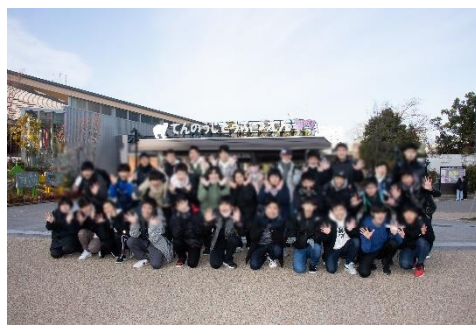
【一年生校外学習の様子】

この一年で六期生全員の仲間意識も高まり、「むらの校生」として逞しく成長しています。「チャンス」は掴みました。四月からは、いよいよ「チャレンジ」のステージです！