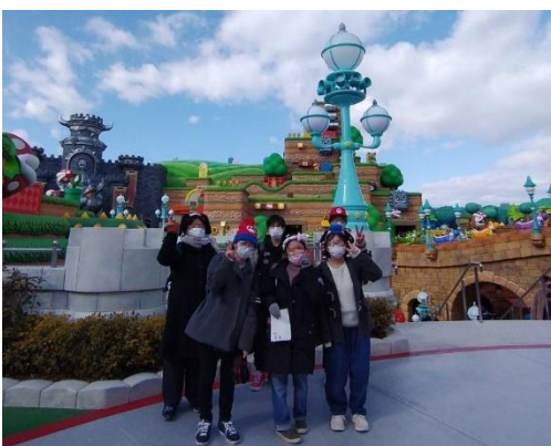
【二年生研修旅行の様子】

食中に会話はできませんでしたが、仲間との昼食は楽しいものです。午後は劇団四季の「リトルマーメイド」を鑑賞し、すばらしい歌声と迫力のある演出に感動しました。二日目はユニバーサルスタジオで一日を過ごしました。時折雪が降る寒い日でしたが、各エリアの世界観に心をときめかせながら園内を散策。笑顔あふれる二日間になりました。この思い出を胸にしながら、これからはそれぞれの進路実現に向けて頑張りたいと思います。