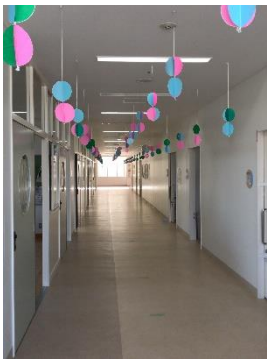
【一年生による校内装飾】

二・三年生の学科は、自分たちで手掛けた物品に自信を持って販売していました。中には新商品もあり、見ているだけでも楽しむことができました。学科によっては、これまで通りの活動ができず、今回は感染症対策として各販売場所の案内や間隔をあけた列の整理、アルコール消毒の呼びかけなど、重要な役割を担った学科もありました。一年生は、これまでのカフェではなくキーホルダーなどの手作り商品を笑顔で販売していました。展示では、家庭科や美術、書道、部活動の作品が展示され、足を止め鑑賞する方も多く見受けられました。今回のスローガン「笑顔で突き進め、光ある未来へ」の通り、生徒たちは笑顔を絶やさず開催を信じて準備を進めた結果、喜びの声と安心した表情で当日学校祭を迎えることができました。