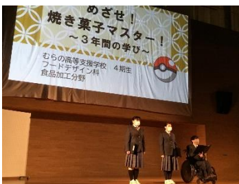
【成果発表会の様子】