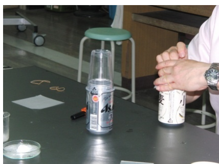
アルコールの爆発