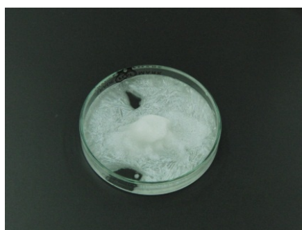
酢酸ナトリウムの結晶