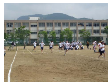
最高に盛り上がった、リレー