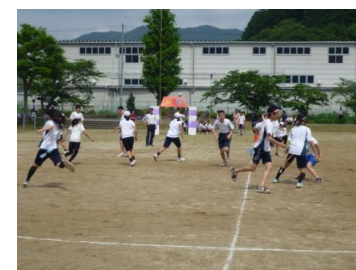
東郷小の子どもたちと