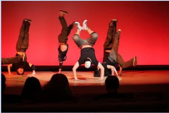
ダンス部 パフォーマンス