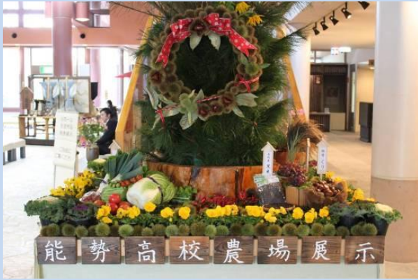
生徒作品のロビー展示