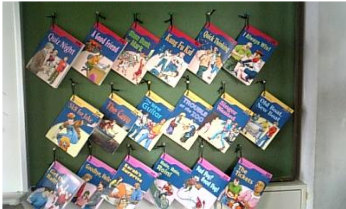
移動教室に備え付けられた多読図書