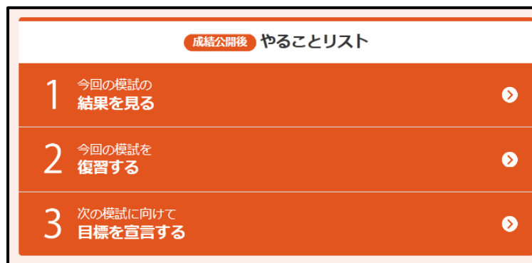
図1 「成績公開後」の模試デジのトップページ