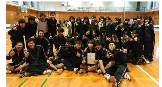
↑優勝した2年4組の写真