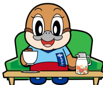
不要不急の外出自粛