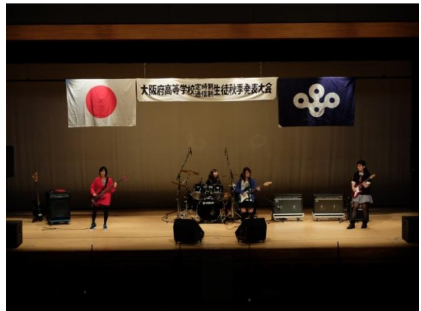
定時制通信制 生徒秋季発表大会の様子(H28.10.9)