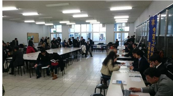
昨年度の合同相談会の様子(H28.2.7)