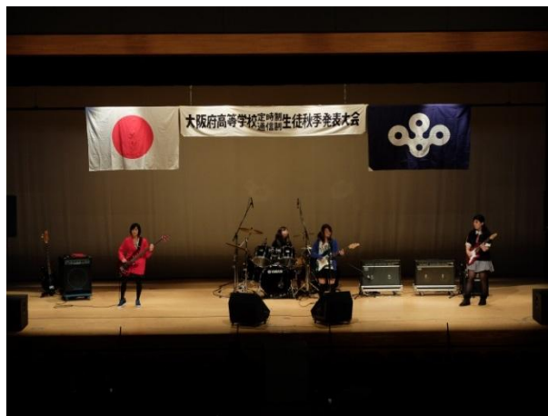
定時制通信制 生徒秋季発表大会の様子(H27.10.11)