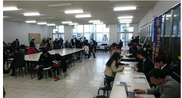
昨年度の合同相談会の様子(H30.2.4)