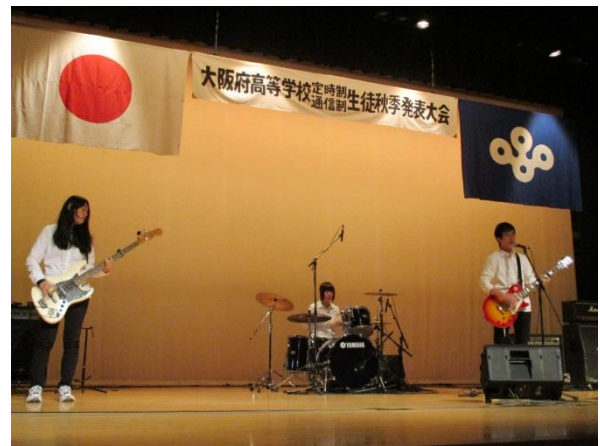
定時制通信制 生徒秋季発表大会の様子(H29.10.8)