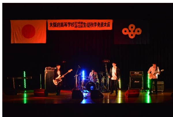
定時制通信制 生徒秋季発表大会の様子