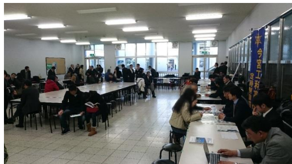
合同相談会の様子