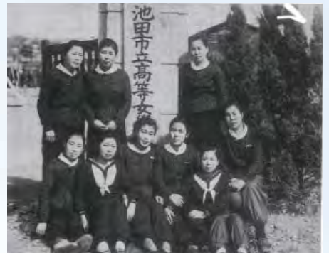
▲当時の制服（左）、高等女学校時代