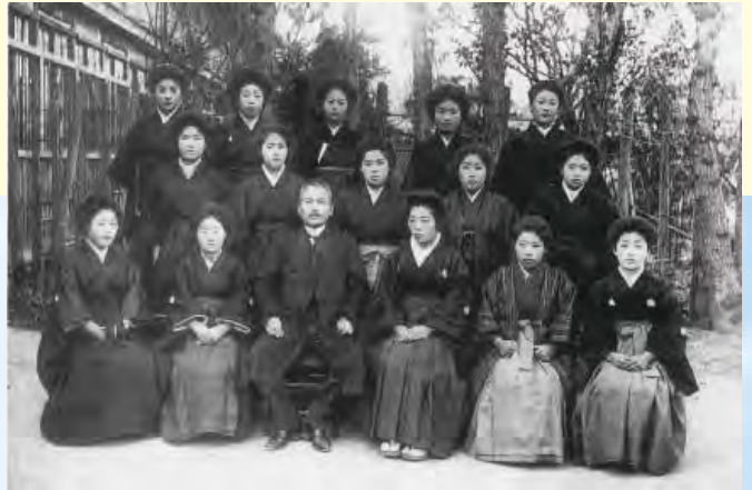
▲第 1 回生卒業記念

昭和 21（1946）年、念願の 5 年制の高等女学校に昇格。祝賀会は 3 日間に渡り市を挙げて昇格を祝った。