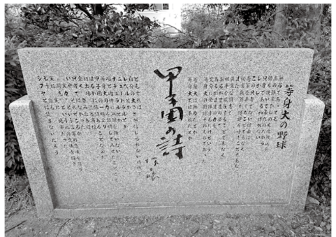
▲平成2(1990)年8月14日、渋谷高校同窓会建之の「甲子園の詩」