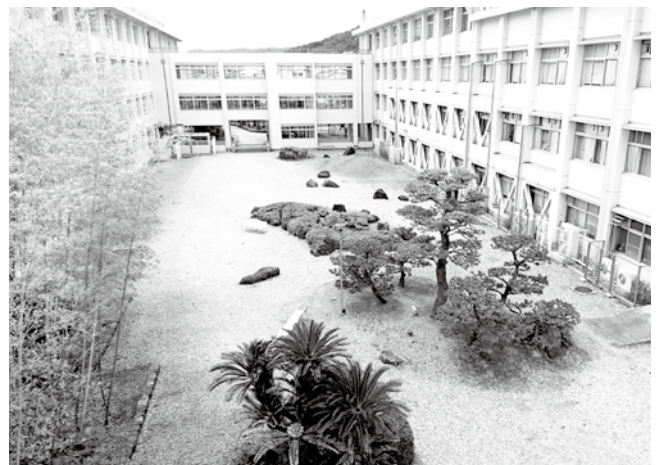
▲現在の中庭の様子