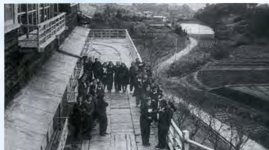
▲池田市立高等学校第一回卒業生

昭和 42 (1967) 年 11 月 4 日、50 周年記念式典挙行。当時記念事業として整備された庭園の松をはじめとする木々は、現在の校舎新設の際に移植されている。