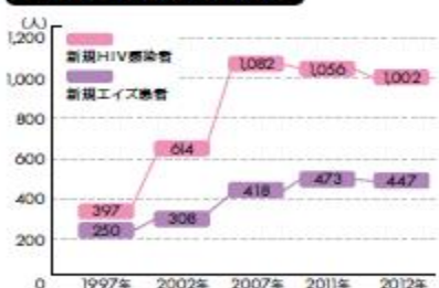
HIV・エイズ患者の推移

エイズは予防できる病気なのに、10年前に比べると2012年の新規HIV感染者は約1.6倍に、新規エイズ患者は約1.5倍に増えています。また、新規HIV感染者は歴代6位、新規エイズ患者は歴代3位という多さでした。エイズは決して過去の病気でも、ひとごとでもなく、1人1人が自分のこととして注意しなくてはならない身近な病気なのです。