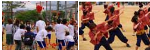
(上)黒豹団シンボル (右)クラス対抗リレー (左)朱雀団の応援

競技:朱雀 応援:朱雀 ゼッケン:朱雀 同点首位:黒豹 シンボル:黒豹 総合:朱雀