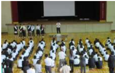
しっかりと抱負を語ってくれました

終業式に先立ち、生徒会の立会演説会と投票が行われました。立候補者たちの 力強い演説 を聞き、生徒たちは盛んに拍手を送っていました。