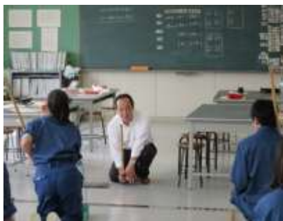
モップのセットの仕方です

10月3日（金）、株式会社丸誠環境システムのビルクリーニング技能士の方にご来校いただき、1年生に対して「清掃」の特別授業をしていただきました。ほうきの持ち方、モップのセットの仕方などの技術面だけでなく、約40分の講義とその後の実技指導で、「安全に留意して掃除をする」という心構えを、実際に