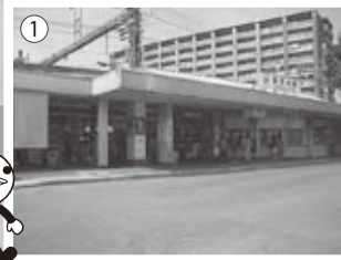
①今は複線になった富田林駅（通称：本駅） 北側にはマンションがでぎ、田舎の駅とい う風ではなくなった。