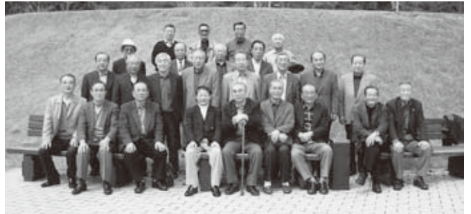
H18. 4. 4撮影 総会25名参加(於:岸和田市 牛滝温泉 いやよかの郷)