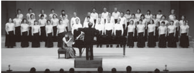
第1回 富田林高校 ももせ合唱団演奏会 2007年10月26日 於 LIC はびきの ホールM

念演奏会にてパリ アテネ座で「道成寺物語」のタテ鼓として出演、11月、12月にもいくつかの公演が予定されています。