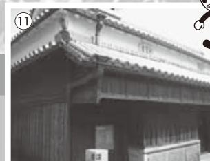
⑪木口家 屋号を「木綿屋」とし、木綿商を営 んでいました。 18世紀中期の建物