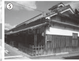
⑤奥谷家 屋号を「岩瀬屋」とし、油屋を営んでいま した。 東側の排水路はかつて防火用の「用心堀」でした。