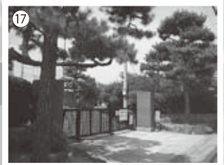
⑰富田林高校旧正門