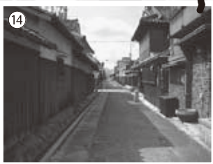
⑭あてまげ 町筋の道と道を半間ずらし、見 通しを妨げています。 寺内町は戦国時代のさなかで町を戦乱から 守るための知恵です。