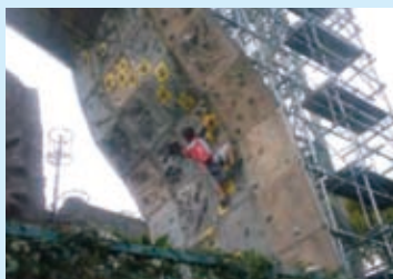
近畿大会競技風景