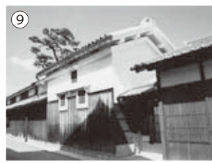
⑨葛原家 屋号を「たばこ屋」とし、酒造業を 営んでいました。 表玄関を持つ別座敷、土蔵が有り、(南)葛 原家には珍しい三階倉があります。