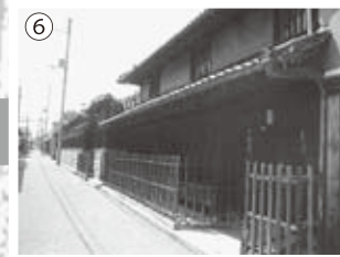
⑥越井家 屋号を「平尾屋」とし、材木商を 営んでいました。 明治末期の建築で長大な米倉があります。