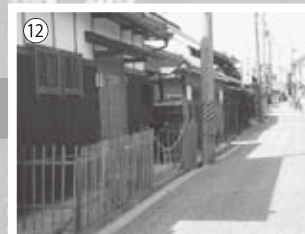
⑫仲村家 屋号を「佐渡屋」とし、酒造業を営ん でいました。 文人墨客が多く訪れ、長州藩士吉田松陰もそ の内の一人です。