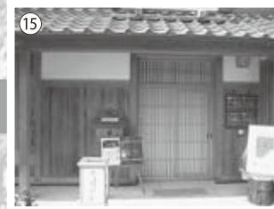
⑮交流館（寺内町探訪）