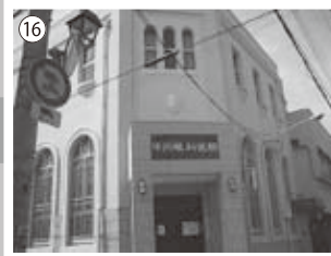
⑯旧三和銀行（現 中内眼科医院）