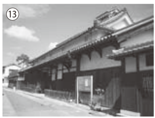
⑬杉山家 寺内町創設以来の旧家で酒造業を 営んでいました。 歌人石上露子の生家で民家の中 で最も古い遺構で規模も大きく 質の良い商家の住宅として重要 文化財に指定されました。