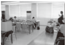
9月13日、14日に開催します文化祭の演劇の練習風景です。3年8クラスの演劇はなかなか評判がよく、公演されます富田林公会堂がいつもあふれかえり、喜びの悲鳴を上げています。

在校生が土曜日に学校で自学自習できるように、自習室を開放しています。そのとき、卒業生を講師として配置し生徒の質問を受けています。その講師料を援助していただいております。