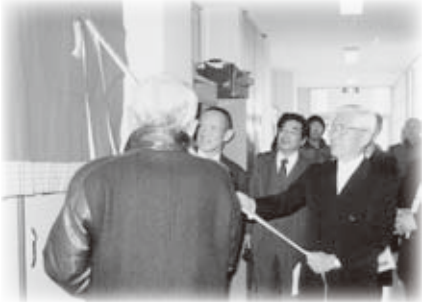
閉課程記念式典 ありがとう富定の灯 大阪府立宮田高等学校定時制の課程