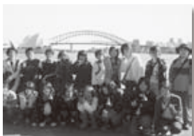
リートン高校へ語学研修