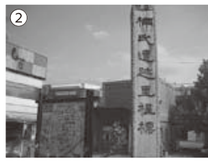
②楠木正成の碑（富田林駅前）