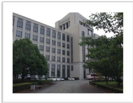
送迎バスにて10:30に到着

7月18日（土）、大阪工業大学（枚方キャンパス）に工学系1年生が訪問しました。ガイダンスの後、班に分かれてキャンパス内を見学しました。「CG映像、バーチャル空間、タブレット端末を使ったプログラミング、ロボットとのコミュニケーション・スマホを使ったファッションコーディネート、3Dプリンターや人工知能による研究等、普段では見ることでできないITの先端設備と技術に触れることができました。また、さまざまな学科の違いや特定の学科に興味をもつ事ができた生徒等、とても良い体験をすることができました。