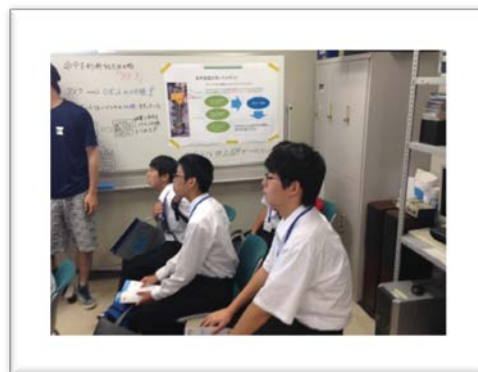
音声認識ロボットの説明を聞く生徒たち