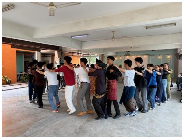
マレーシアのダンスを教わります