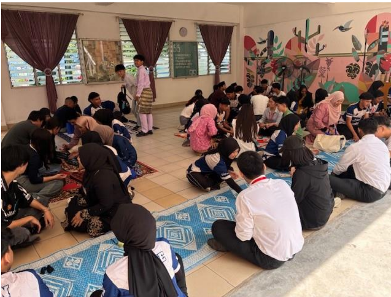
マレーシアの遊びを教わっています