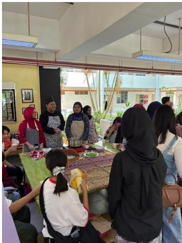
学校交流 1人1人にバディがつきます