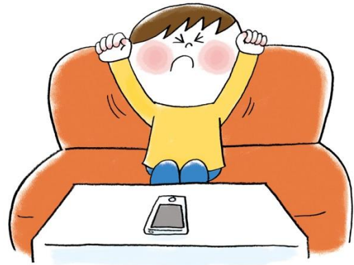
きゅうけい スマホは休憩をとりながら