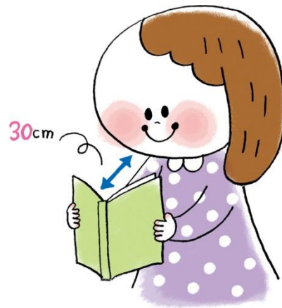
ほん 本やスマホからは目を離してね