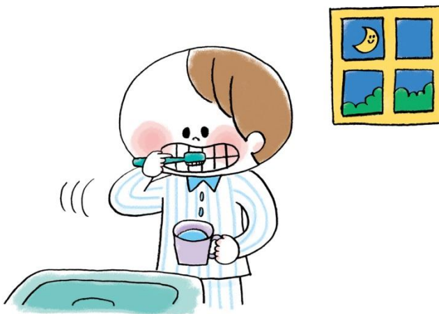
ね まえ 寝る前はしっかりとみがこう