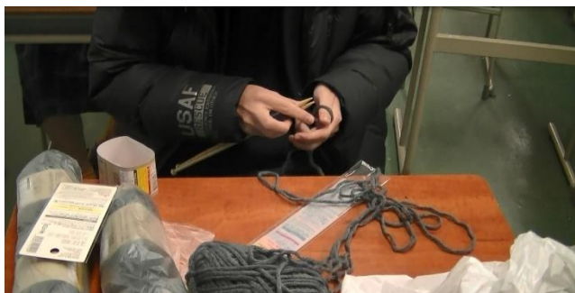
メリヤス式でマフラーを編んでいます