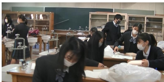
ピンホールカメラの工作風景