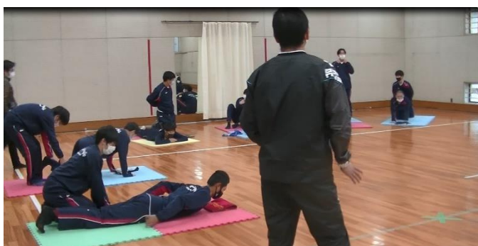
ペアでストレッチ