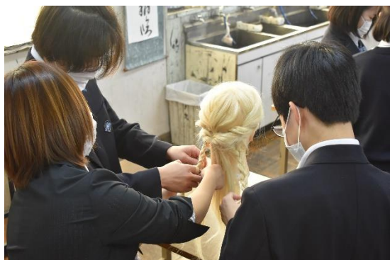
美容・利用 高津理容美容専門学校