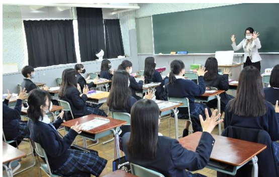
幼児教育・保育 四条畷学園短期大学