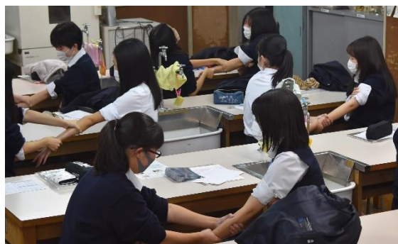
ミス・パリ エステティック専門学校