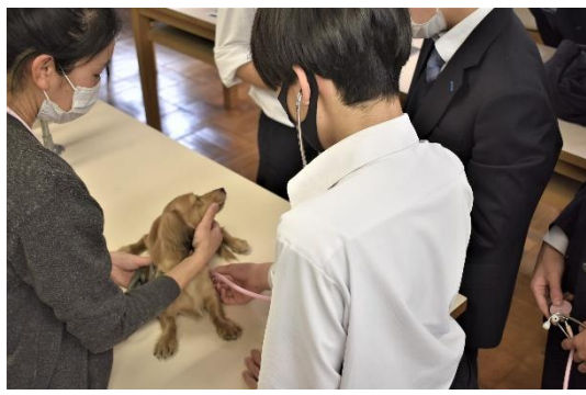
動物看護師 大阪ECC動物界用専門学校