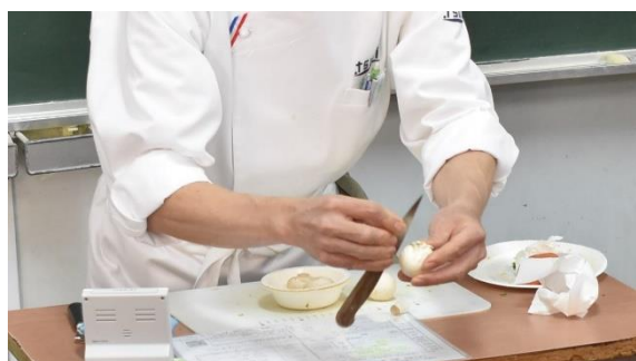
調理分野 大阪あべの辻調理専門学校