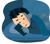
寝る前のスマホチェックを 習慣にはいけません！