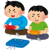
自分だけは大丈夫といって、 友人と会うのは避けよう！