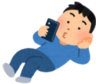
スマホを持っているなら 学習動画を利用しよう！

学校が休みだからといって夜遅い時間まで起きていたり、一日中ゲームをしたり…。またはダラダラと布団の中で過ごしていませんか？授業が再開すれば、みなさんは先述の【今後の就職活動スケジュール】をこなしていかなければなりません。みなさんの就職活動をスムーズに進めるためには、『今やらなければならないことを後回し』『提出期限が守れない』ということはあってはなりません。自宅に居てもできることを紹介しますので、これをきっかけに、休業中の生活リズムを整えていきましょう。そして、就職一次試験で合格するための努力を惜しまず、全員で合格を勝ち取りましょう！！