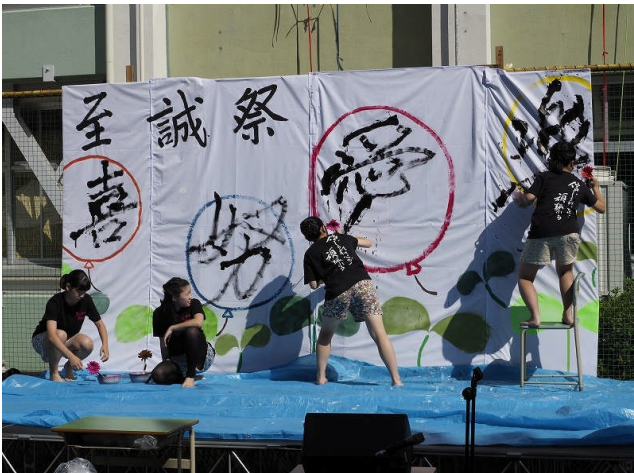
開会式恒例のパフォーマンス。書道部員が今年のテーマを書いてくれます。