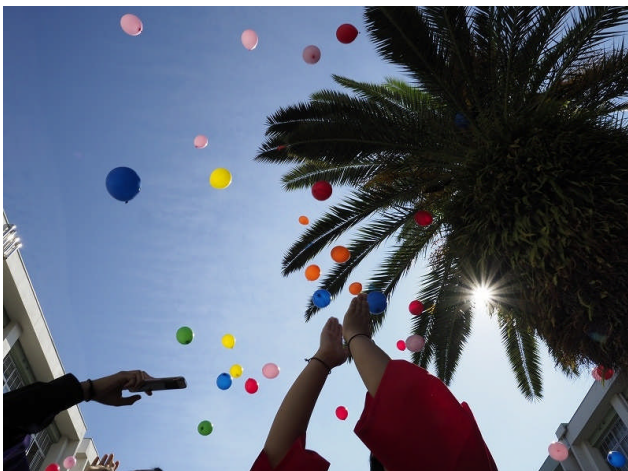
150個の風船が空に舞い上がります。