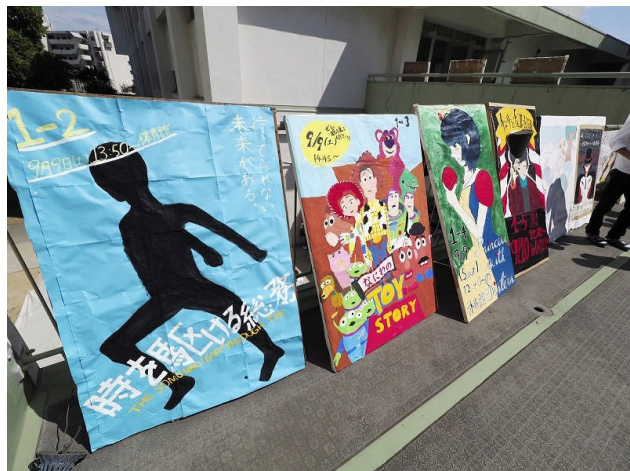
1年生の立て看板。劇や映画を上演しました。