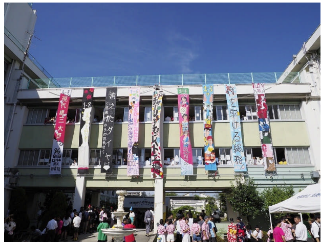
天気にもまれ、秋晴れの爽やかな文化祭に。