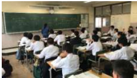
E系 電気工事講習の様子