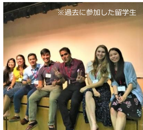
※過去に参加した留学生