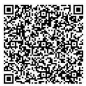
メール相談のQRコード