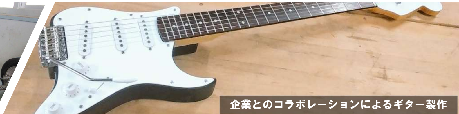
企業とのコラボレーションによるギター製作