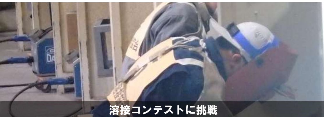
溶接コンテストに挑戦