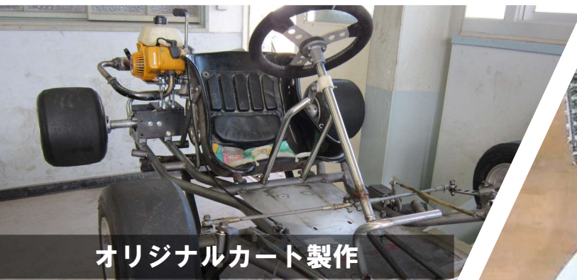
オリジナルカート製作