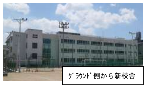
ゲラント側から新校舎