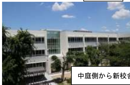
中庭側から新校舎