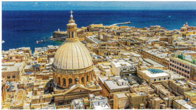
世界遺産のパレッタの街並み (イメージ)

■ マルタ共和国 首都: ヴァレットタ (Valletta) マルタ島、ゴゾ島、コモノ島 人口: 約51万人 政治: 共和制 (EU加盟国) 公用語: マルタ語、英語 宗教: ローマン・カトリック