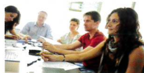
レッスン (イメージ)

1988年設立の English Language Academyは、マルタ大学に近接した環境の良い語学学校。グループレッスンを、プレースメントテスト結果によりクラス分けで実施します。 レッソンの後は、アクティビティが盛りだくさん！ 世界遺産のヴァレットタ市街、静寂の古都イムディーナ見学、ゴゾ島遠足やハーバークルーズ乗船ツアーなど、フォトジェニックな見どころがたくさんです！