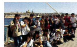
アクティビティ (イメージ)